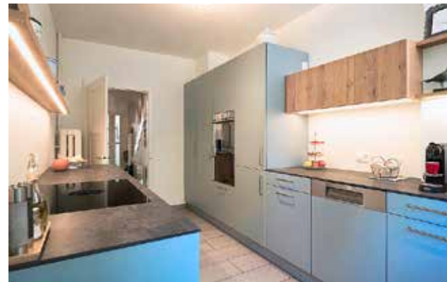
Links: Die gerade Linienführung lässt die Küche optisch ruhiger wirken.

3 Bei der Wahl der Arbeitsplatten ist Keramik nach wie vor ein Favorit. Und dies aus gutem Grund: Das Material ist in seiner Robustheit kaum zu übertreffen, ist besonders kratzfest und hitzebeständig. Auch in der Basler Küche wurde eine 12 mm dünne Arbeitsplatte aus Keramik von Neolith in der Farbe Iron Grey eingebaut.