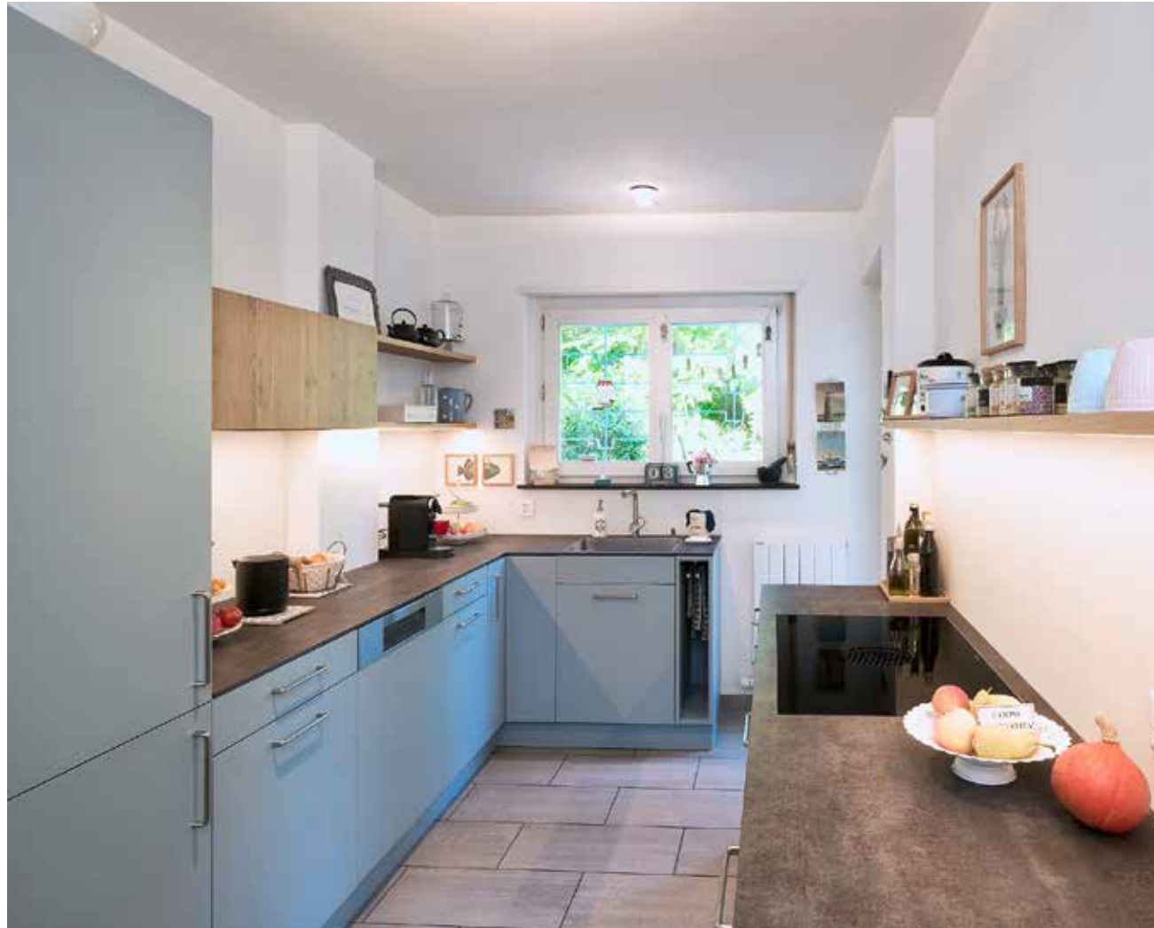
Links: Trotz ihres engen und schmalen Grundrisses wirkt die geschlossene Küche geräumig.

Mit dem Ergebnis sind sowohl die Eheleute als auch der Projektleiter überaus zufrieden. Die schlichte Gestaltung, die Kombination von Holz und Farbe sowie die Helligkeit und Leichtigkeit der Küche sind für alle ein Highlight. Redaktion (Lu)