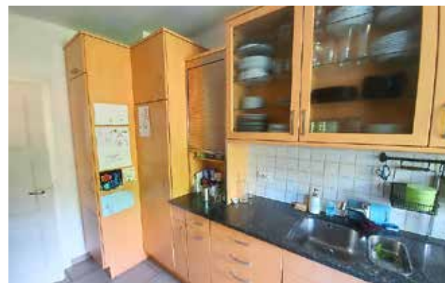
Links unten: Wegen der Mauervorsprünge waren die Schränke in der alten Küche versetzt angeordnet; dadurch wirkte das Gesamtbild zerklüftet und unruhig. Die vielen Hängeschränke liessen den Raum zusätzlich eng und schmal erscheinen.